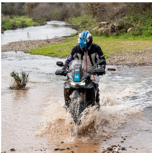
EERSTE TEST CFMOTO 800 MT-X: OMSLAGPUNT