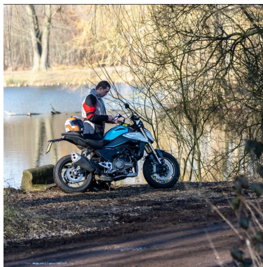
WINTES DOORRIJDEN MET DE QJMOTOR SRK 550