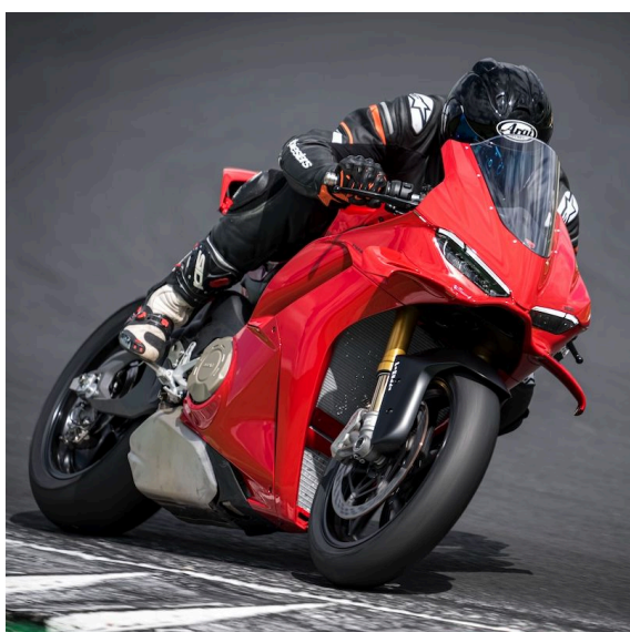
EERSTE TEST: 2025 DUCATI