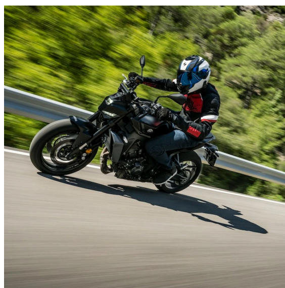
EERSTE TEST YAMAHA Y-AMT: